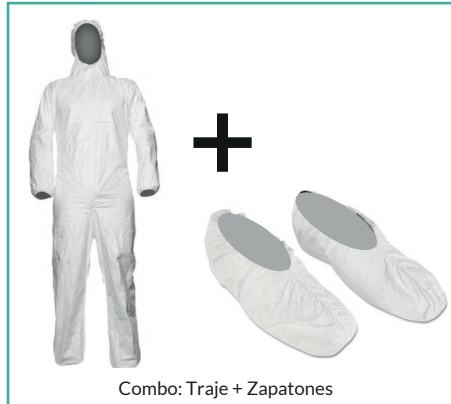
Combo: Traje + Zapatones